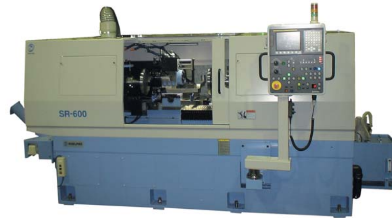
太径長尺ドラム加工機