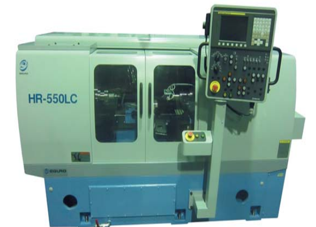
マグローラー外径加工機