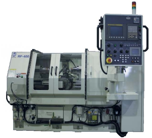
感光ドラム仕上加工専用機