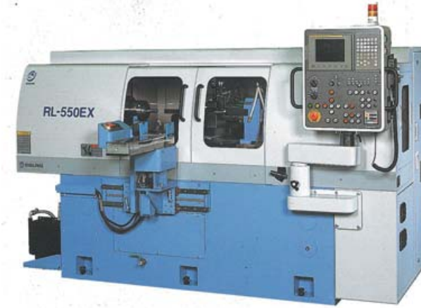
感光ドラム仕上加工専用機