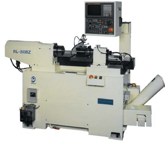
マグローラー外径加工機