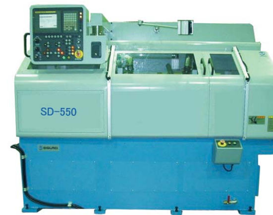
感光ドラム仕上加工専用機